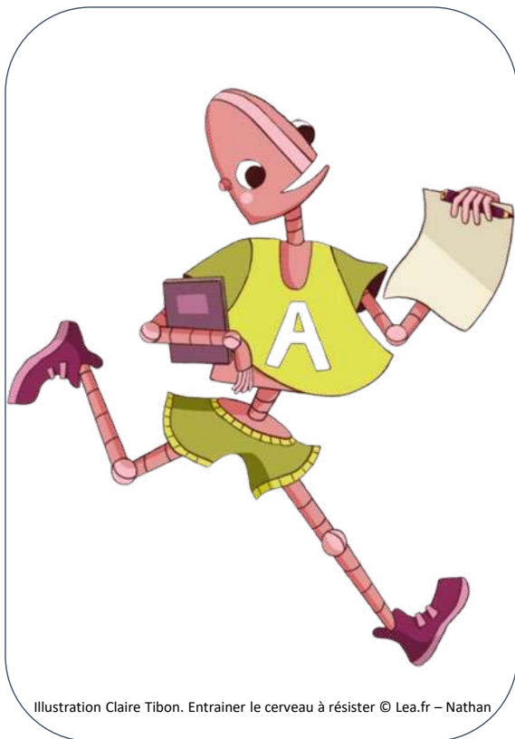
Illustration Claire Tibon. Entraîner le cerveau à résister