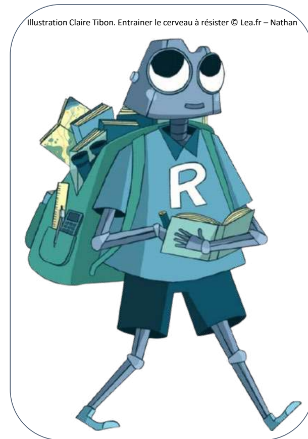
Illustration Claire Tibon. Entraîner le cerveau à résister © Lea.fr – Nathan

Parfois l'émotion est utilisée pour nous attirer vers une information et nous y faire croire plus facilement.