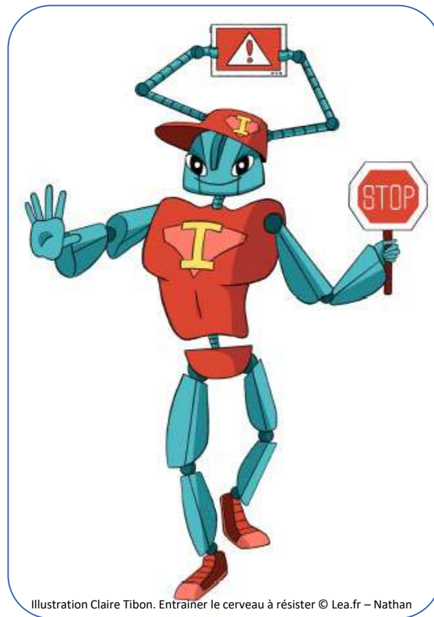
Illustration Claire Tibon. Entraîner le cerveau à résister © Lea.fr – Nathan

Je suis touché et intéressé par une information qui est associée à une émotion forte. J'ai tendance à y croire ou à vouloir la partager.